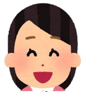
ペプ子 (二次代理店)

とうもろこしの粒の皮？ 飲酒対策？？レバープロテクト？？？ それは一体何だい？？！