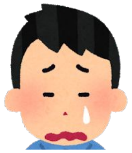
ペプ次郎 (飲食店経営)